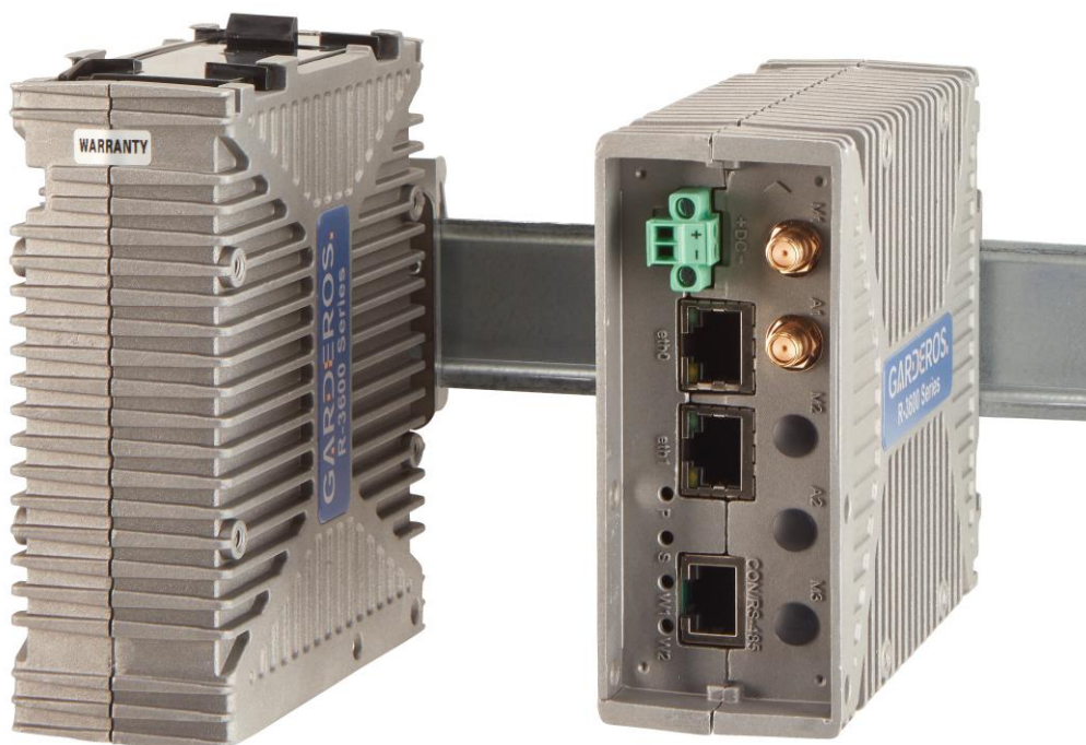
Abbildung 1: Garderos R-3600 Router mit Single Radio optimiert für Smart-Grid.

Sichere und zuverlässige Konnektivität für professionelle industrielle Anwendungen in den Branchen Telekommunikation, Energie und Verkehr. Die Garderos R-3600 Serie hat 2 LAN-Schnittstellen und eine WAN-Funkschnittstelle für öffentliche und private LTE-Netze. Die Router der Garderos R-3600 Serie sind speziell für den Einsatz an entfernten, schwer zugänglichen Lokationen mit rauen Umgebungsparametern entwickelt. Optimierter Single-Radio-Router für den großflächigen Einsatz in Smart-Grid- und Smart-Meter-Anwendungen.