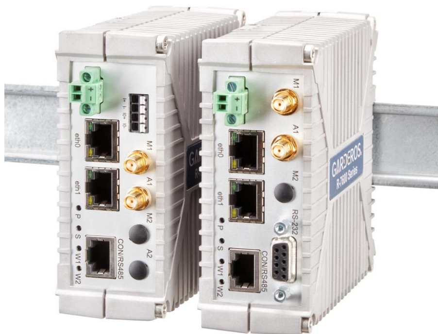
Abbildung 1: Garderos R-7600 Router mit Single Radio optimiert für Smart-Grid.

Sichere und zuverlässige Konnektivität für professionelle industrielle Anwendungen in den Branchen Telekommunikation, Energie und Verkehr. Die Garderos R-7600 Serie hat 2 LAN-Schnittstellen und eine WAN-Funkschnittstelle für öffentliche und private LTE-Netze. Die Router der Garderos R-7600 Serie sind speziell für den Einsatz an entfernten, schwer zugänglichen Lokationen mit rauen Umgebungsparametern entwickelt. Optimierter Single-Radio-Router für den großflächigen Einsatz in Smart-Grid- und Smart-Meter-Anwendungen.