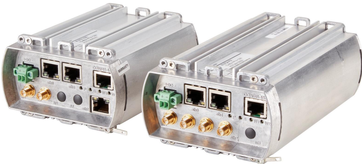
Abbildung 1: Garderos R-2700 Router für die Installation in Lichtmasten.

Sichere und zuverlässige Konnektivität für professionelle industrielle Anwendungen in den Branchen Telekommunikation, Energie und Verkehr. Die Router der Garderos R-2700 Series sind für den Einsatz an entfernten, schwer zugänglichen Orten mit rauen Umgebungsparametern entwickelt. Durch Ihre abgerundete Bauform eignen sie sich speziell für den Einbau in Straßenbeleuchtungsmasten.