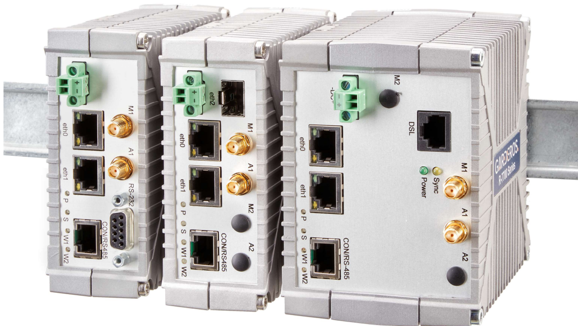
Abbildung 1: Garderos R-7700 Multifunktionsrouter.

Sichere und zuverlässige Konnektivität für professionelle industrielle Anwendungen in Telekommunikation, Energieversorgung und Verkehrsüberwachung. Die Garderos R-7700 Serie hat 2 LAN-Schnittstellen und eine umfangreiche Auswahl von WAN-Schnittstellen, wie z.B. xDSL und LTE für öffentliche und private Netze. Optional ist auch WiFi bestellbar. Mehrere WAN-Schnittstellen ermöglichen Redundanz zwischen verschiedenen Funk- und xDSL-Netzen. Die hohe Leistung unterstützt auch den Einsatz virtuellen Containern.